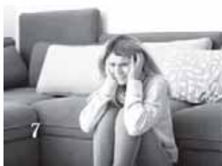
Как перестать бояться коронавируса