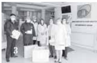
#МыВместе против коронавируса