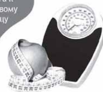
контроль веса и отказ от вредных привычек

предполагают соответствие потребления с пищей калорий энергозатратам организма в течение суток, сбалансированность и разнообразие питания. Для снижения риска сердечно-сосудистых заболеваний важно ограничить употребление продуктов с высоким содержанием сахара, животных жиров, ввести в ежедневный рацион употребление более 500г овощей, фруктов (без учета картофеля), ограничить поваренную соль, обогащать рацион цельнозерновыми продуктами, а также продуктами, богатыми полиненасыщенными жирными кислотами (растительные масла, рыба морских сортов).