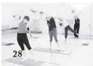
Физические упражнения при заболеваниях органов дыхания