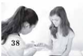
Что такое сахарный диабет? Вводная лекция