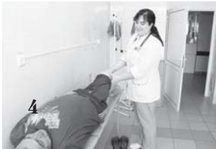
Нельзя оставаться наедине с болью