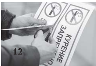
Дело - антитабак