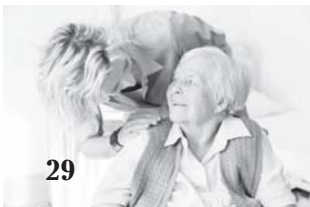
Молодость - это выбор!