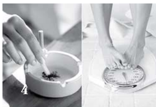
Профилактика рака - это возможно