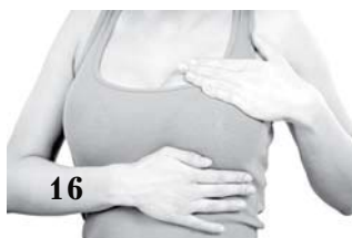
Жить нельзя сдаваться. Куда поставить запятую - решает женщина