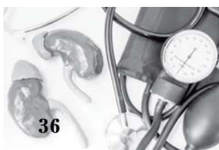
Нездоровые почки и аритмия сердца