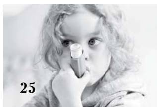
Что такое бронхиальная астма?