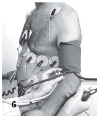
Вам предстоит операция на сердце