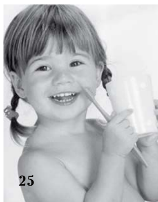
Профилактика кариеса у детей