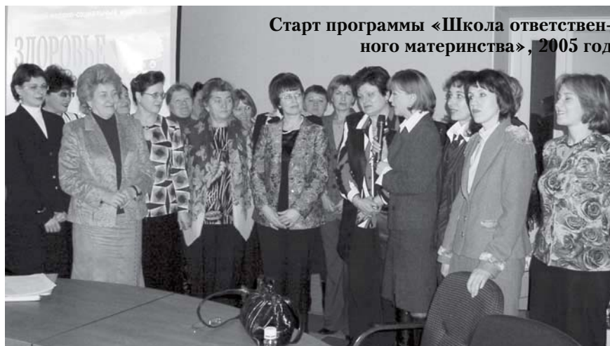
Старт программы «Школа ответственного материнства», 2005 год

Поэтому реализация проекта стала возможностью распространения своей идеи, возможностью